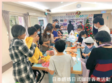
日本媽媽日式咖啡煮煮活動