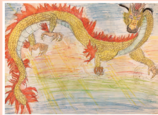
院生夜狼畫作《飛龍在天》