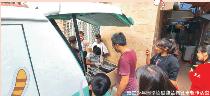
更生少年關懷協會雞蛋籃製作活動