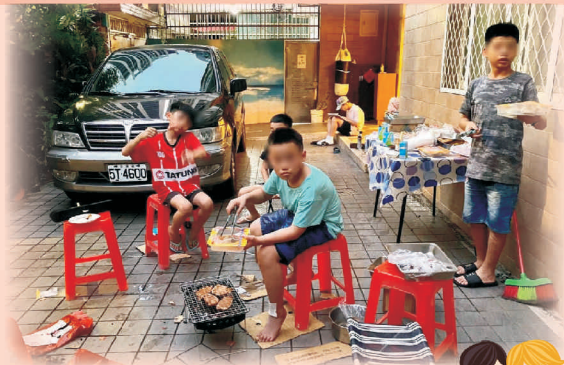
全院中秋烤肉活動

出版：財團法人新北市私立榮光育幼院 發行人：李國輔 董事長 出版人：王絹惠 院長 地址：新北市永和區竹林路75巷11號 立案日期：中華民國五十七年六月五日 電話：(02)8927-6225 編輯：小咪 承印：麗匠印刷公司 網址：http://www.glorryhome.org.tw 劃撥帳號：05566601 榮光育幼院