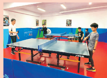
仁愛扶輪社桌球活動