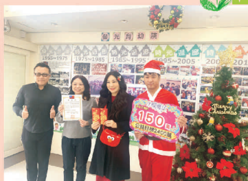
沈煥慶魔法學院拜訪本院致贈歲末關懷金