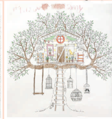
院生 Sunny 畫作《樹屋》