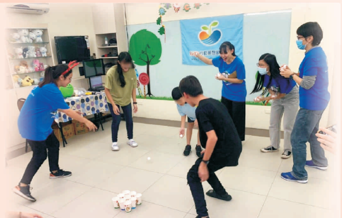
Big行動夢想家聖誕關懷活動