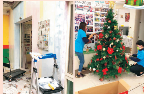
孩之寶玩具公司一日志工-粉刷外牆 孩之寶玩具公司一日志工-布置聖誕樹

但我們畢竟不是他們的家人，僅僅是他們生命中的過客，不同時期的照顧者就像接力般，在他們的心裡放下一塊又一塊的奠基石，讓他們慢慢的有力量在生命的道路上一步一步向前，即使不在此刻開花結果，也終有一天走出自己的路。