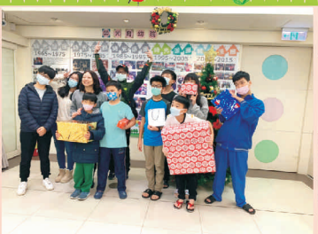
國防部聖誕禮物贈送