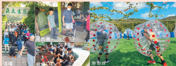
羅東網路扶輪社贊助林口亞太生態園區一日遊