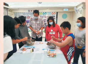
柏泰食品萬聖節黑色鬆餅DIY